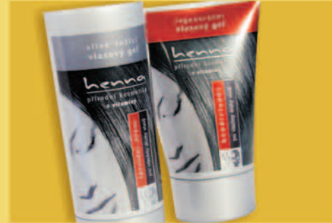
Ofsetový potisk Offset Printing