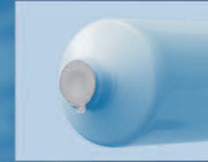
Ochranná membrána Protective Membrane

Jednovrstvé polyetylenové tuby - LDPE, LLDPE, HDPE a jejich směsi Mono layer Polyethylene tubes - LDPE, LLDPE, HDPE and mixes