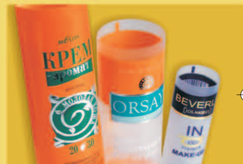
Horká ražba Hot Stamping