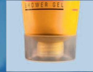
Šroubovací uzávěr Screw Cap