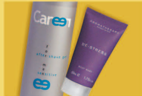
Sítotisk Silk Screen Printing