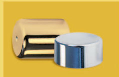
Pokovování uzávěru Metallising of Cap