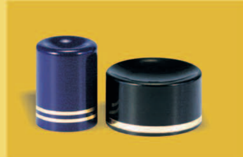
Obvodová horká ražba uzávěru Periphery Hot Stamping on Cap